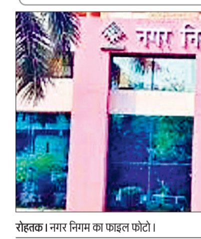
रोहतक। नगर निगम का फाइनल फोटो।

नगर निगम और एचएसवीपी के अधिकारियों ने बताया कि पाइपलाइन की क्षति पिछले दो दिनों से बनी हुई है।