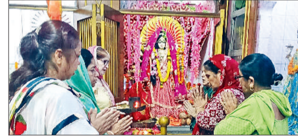
रोहतक। माता दरवाजा स्थित संकट मोचन मंदिर नवरात्र महोत्सव पर मां शैलपुत्री की पूजा अर्चना करते भक्तजन।