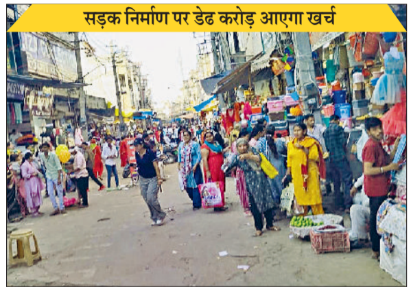
रोहतक। किला रोड बाजार का दृश्य।

पिछले वर्ष दीपावली पर जिले में कुल 530 मेगावाट लोड दर्ज किया गया था। इस दौरान कई जगहों पर बिजली कटौती की शिकायतें भी आई थीं। शिकायतों की संख्या करीब 850 रही, जिनमें से अधिकतर मामले ओवरलोडिंग और फॉल्ट से जुड़े थे। निगम का दावा है कि इस बार अतिरिक्त तैयारी के चलते शिकायतों की संख्या आधे से भी कम रह जाएगी।