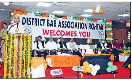
गुजरात एवं महाराष्ट्र के राज्यपाल आचार्य देवव्रत ने प्रकृति और विधि के बीच गहरे संबंध को परिभाषित करते हुए बताया कि कैसे वैदिक मूल्य, प्राकृतिक संतुलन और विधिक व्यवस्था एक-दूसरे के पूरक हैं।

गुजरात एवं महाराष्ट्र के राज्यपाल आचार्य देवव्रत ने प्रकृति और विधि के बीच गहरे संबंध को परिभाषित करते हुए बताया कि कैसे वैदिक मूल्य, प्राकृतिक संतुलन और विधिक व्यवस्था एक-दूसरे के पूरक हैं। उन्होंने विशेष रूप से प्राकृतिक खेती की आवश्यकता पर जोर दिया और कहा कि प्राकृतिक खेती भूमि को उपजाऊ बनाती है, जबकि रासायनिक खेती भूमि को बंजर कर देती है। इसके साथ ही उन्होंने बेटी बचाओ-बेटी पढ़ाओ, नशा मुक्ति अभियान, एवं वैदिक मूल्यों के